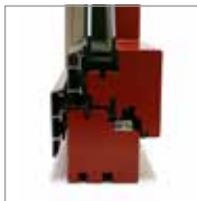
Décalé (voir ci-contre)